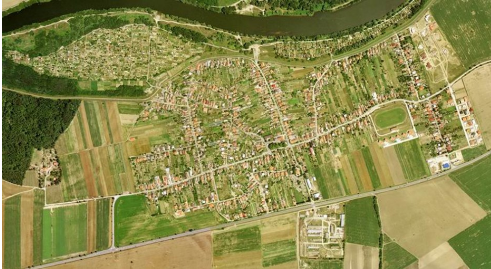
Obrázok č.2: Pohľad na obec Kráľová nad Váhom z výšky

V Obci Kráľová nad Váhom žije v k 31.12.2023 1 860 obyvateľov. Od roku 2001 do roku 2022 vývoj počtu obyvateľov obce zaznamenal stúpajúcu tendenciu. V Obci Kráľová nad Váhom pribúdajú nové stavebné pozemky vďaka ktorým sa obec rozrastá a jej počet obyvateľov je každým rokom o niečo vyšší.