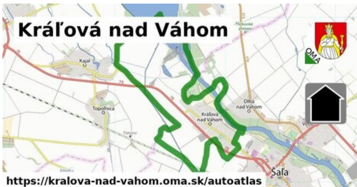
Obrázok č.1: Hranice katastrálneho územia obce susedia s katastrami obcí Diakovce, Topoľnica, Kajal, Váhovce, Šoporňa, Dlhá nad Váhom a mestom Šaľa

Podunajská nížina na ktorej sa obec rozprestiera patrí do teplej klimatickej oblasti s priemerom 50 letných dní ročne. Priemerná ročná teplota je 9,8 C , priemerný ročný úhrn zrážok je 550-600 mm a priemerná vlhkosť vzduchu je 80 %.