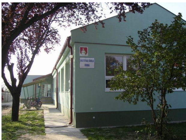
Obrázok č. 7: Materská škola