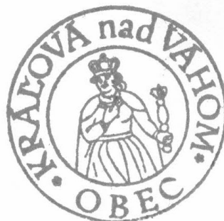
Obrázok č. 4: Pečiatka obce Kráľová nad Váhom