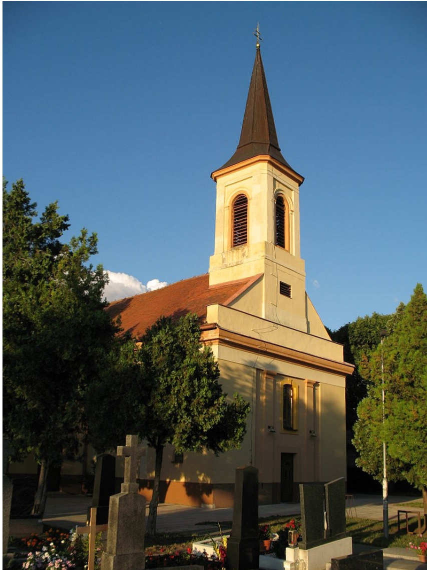
Obrázok č. 6: Kostol Svätej Alžbety