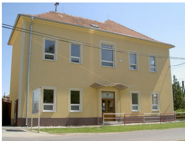
Obrázok č. 8: Základná škola