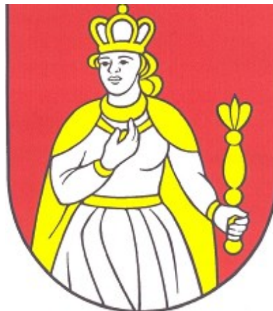
Obrázok č. 3: Erb obce Kráľová nad Váhom