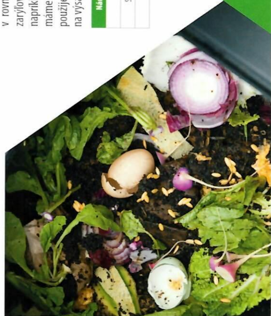
Kompostovanie v záhradných kompostéroch