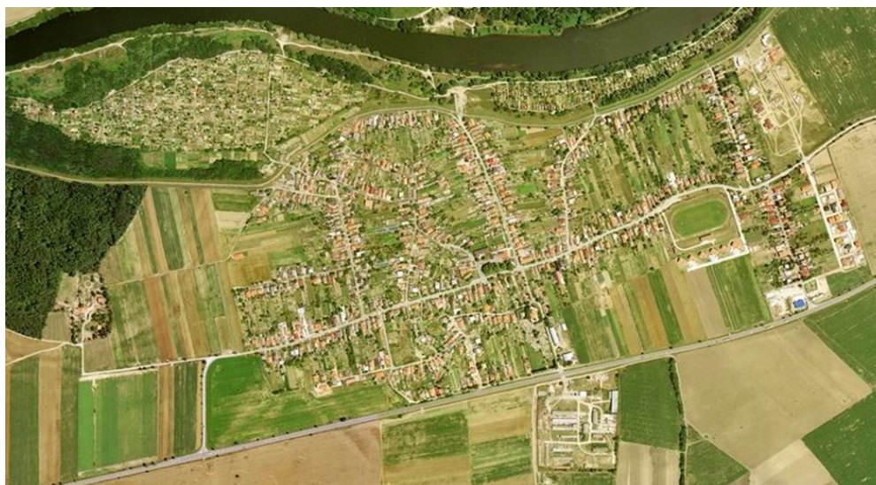
Obrázok č.2: Pohľad na obec Kráľová nad Váhom z výšky

V Obci Kráľová nad Váhom žije v k 31.12.2022 1 848 obyvateľov. Od roku 2001 do roku 2022 vývoj počtu obyvateľov obce zaznamenal stúpajúcu tendenciu. V Obci Kráľová nad Váhom pribúdajú nové stavebné pozemky vďaka ktorým sa obec rozrastá a jej počet obyvateľov je každým rokom o niečo vyšší.