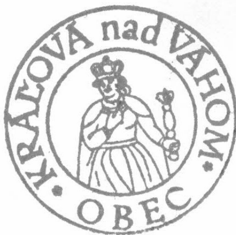
Obrázok č. 4: Pečiatka obce Kráľová nad Váhom