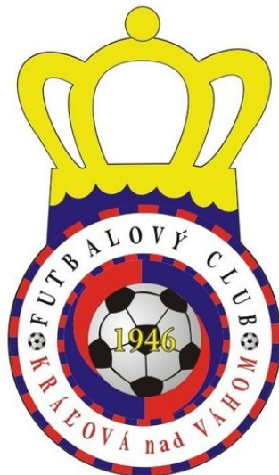
Obrázok č. 10: Futbalové logo FC Kráľová nad Váhom

História futbalu v Kráľovej nad Váhom sa píše už od roku 1990. Každoročne je zostavené mužstvo FC Kráľová nad Váhom, ktoré má momentálne cca 20 hráčov.