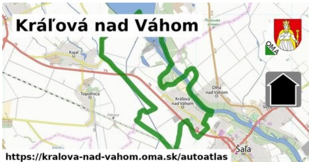
Obrázok č.1: Hranice katastrálneho územia obce susedia s katastrami obcí Diakovce, Topoľnica, Kajal, Váhovce, Šoporňa, Dlhá nad Váhom a mestom Šaľa