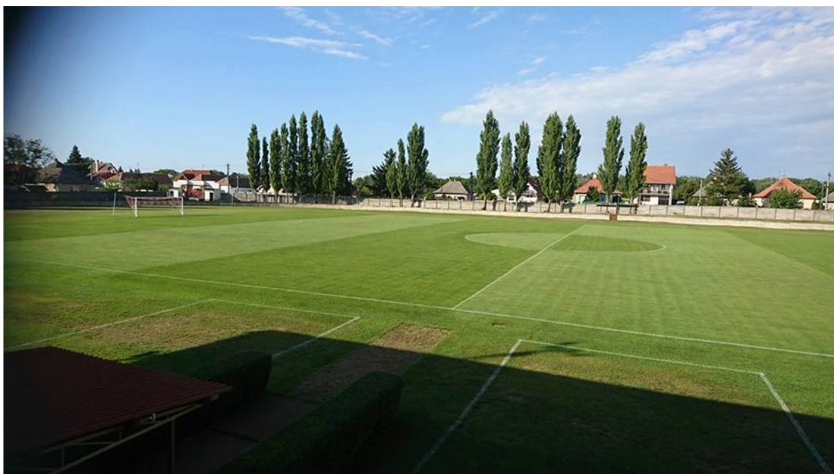
Obrázok č. 11: Futbalový štadión v obci Kráľová nad Váhom